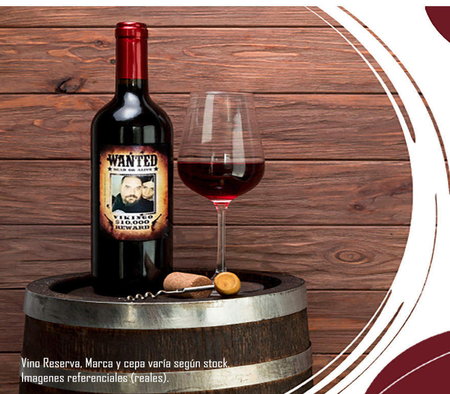
Vino Reserva, Marca y cepa varía según stock. Imágenes referenciales (reales).